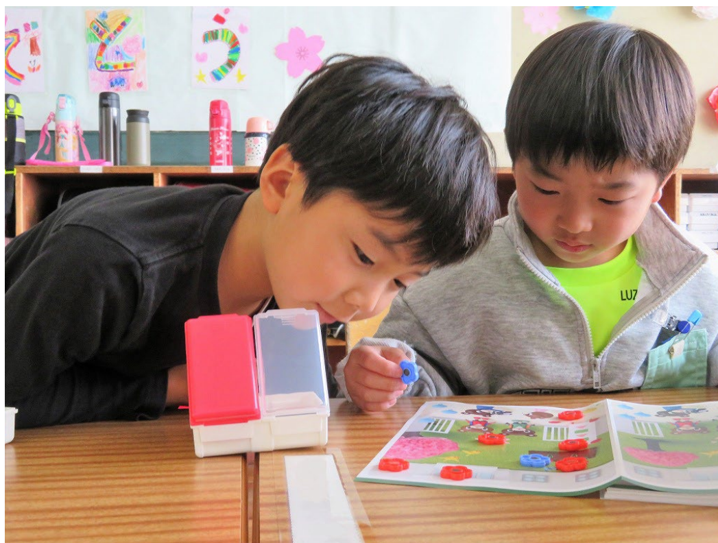
1年生 はじめての算数